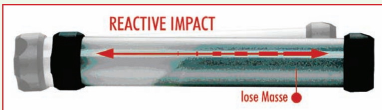
Abb. 1: Reactive Impact – Darstellung am durchsichtigen XCO

Das an eine klassische Kurzhantel erinnernde Trainingsgerät basiert auf der Funktionsweise der Beschleunigung und Abbremsung loser Masse. Die hohle Aluminiumröhre ist mit einem speziellen Granulat gefüllt, das als lose Schwungmasse dient. Durch schnelle Hin- und Her-Bewegung wird diese Masse beschleunigt und anschließend gezielt abgebremst bzw. abgefangen. Der besondere Effekt im Gegensatz zu konventionellen Gewichten, besteht im sogenannten REACTIVE IMPACT, in der zeitversetzten, sich kontinuierlich aufstauenden losen Masse, die von der einen Seite zur anderen geschleudert wird und dadurch den verzögerten Impuls auslöst (siehe Abb. 1).