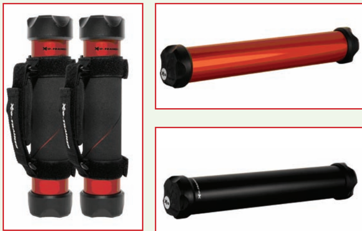
Abb. 2 (links): Der XCO-V als Spezial-Ausführung für Walking & Running trainiert die Schnell- und Explosivkraft und die intramuskuläre Koordination.

Sowohl die intra- als auch intermuskuläre Koordination wird mit dem XCO Training verbessert. Die Muskulatur wird auf schnelle Dehn-Verkürzungs-Zyklen vorbereitet und verbessert die Qualität des Muskeleinsatzes. Die dadurch verbesserte Koordination zeigt sich in deutlicher Leistungssteigerung (Abb. 2-4).